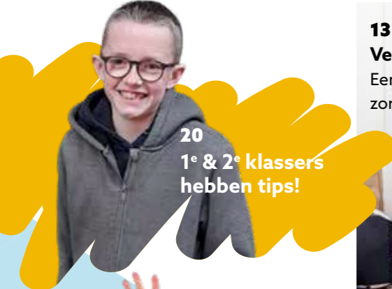
20 1° & 2° klassers hebben tips!