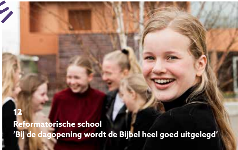
12 Reformatrice school 'Bij de dagopening wordt de Bijbel heel goed uitgelegd'