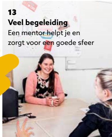
13 Veel begeleiding Een mentor helpt je en zorgt voor een goede sfeer